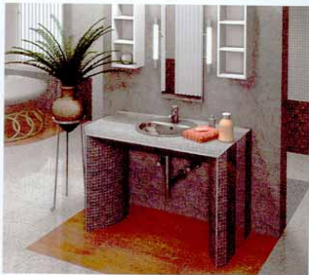
Durch die individuelle Verfliesung können die Waschtische perfekt an das vorhandene Bad-Design angepasst werden