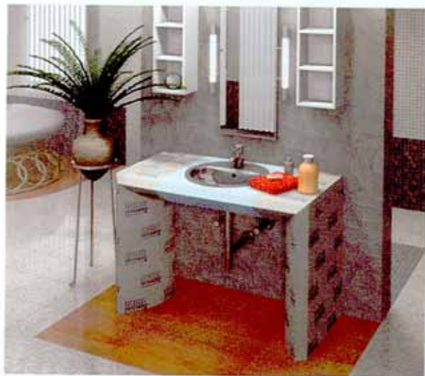
Die Waschtische als komplette Sets gibt es in drei Designvarianten, z.B. die moderne Variante Lux Elements® - Lavo-Art. * *