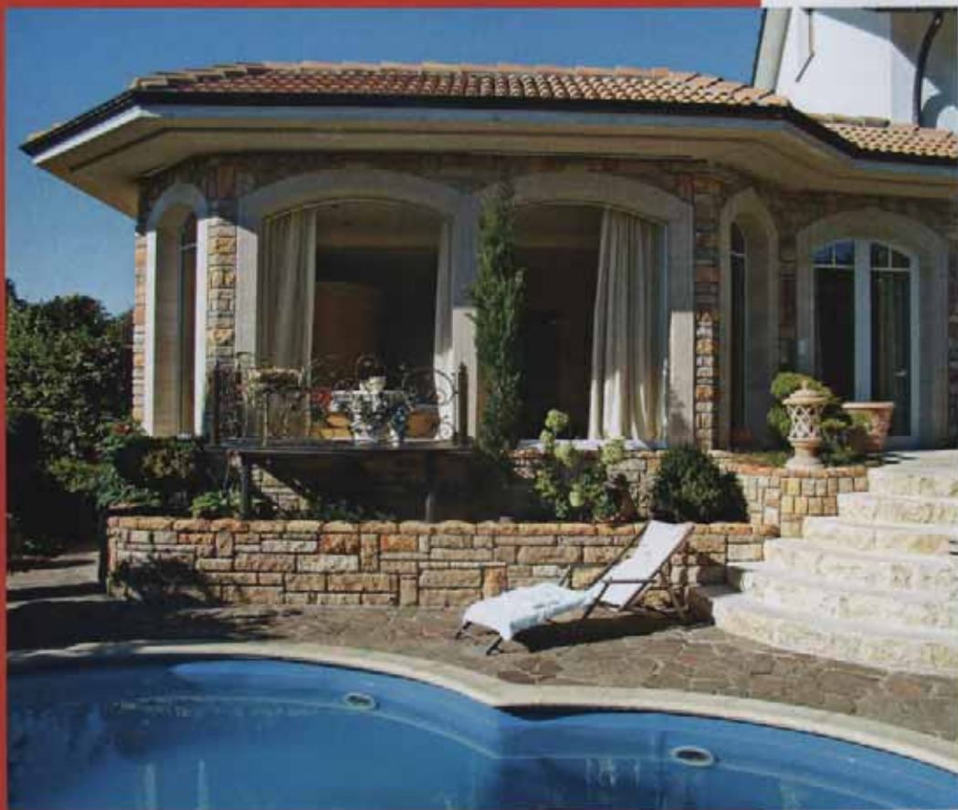
Die Ansicht von außen: Erst gab es den Pool, dann reifte der Wunsch nach einem Wellness-Refugium im toskanischen Stil aus Naturstein mit großen, einladenden Fenstern.