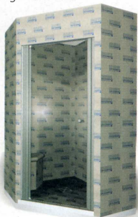
Hartschaum-Trägerelemente bilden die Basis für die Lux-Dampfduschkabine.