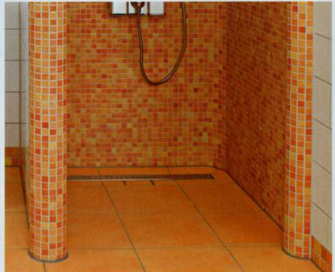
Lux Elements bietet eine große Auswahl an verfliesbaren Duschtassen für die Punkt- und Linienentwässerung.

Die vorliegende Ausschreibung und die Details für die Montage der Duschtassen in den geplanten Hohlraumböden wurden gemeinsam von der beauftragten Ausbaufirma und den technischen Mitarbeitern bei Lux Elements geprüft. Das Ergebnis war schnell klar: die bodengleichen Duschtassen der Serie Lux-Elements-Tub waren technisch kompatibel mit dem ausgeschriebenen Bo-