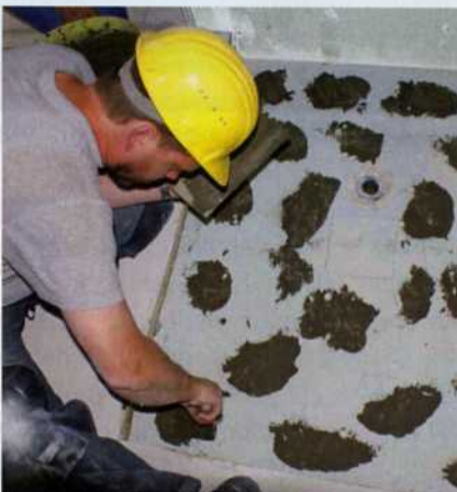
Mit Mörtelbatzen kann ein unebener Untergrund schnell und ohne großen Aufwand ausgeglichen und das Duschelement exakt waagrecht montiert werden.

bodengleichen Duschtassen zur Entwässerung wird bereits im Werk bei der Produktion eingearbeitet, der Ablauf ist ebenfalls werkseitig abgedichtet und die Montage der Ablaufstutzen erfolgt durch ein einfaches Klick-System. Belagsmaterialien wie keramische Fliesen können direkt auf der bodengleichen Duschtasse verlegt werden. Die hohe Ablaufleistung des Systems mit bis zu 1,7 l/Sekunde ermöglicht auch den Einsatz von Regen- oder Schwallbrausen.