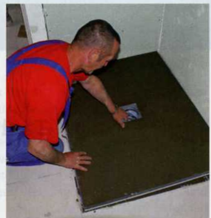
Nach dem Aufsetzen des Duschelements erfolgt nun die Montage des Ablaufs, der einfach angeclipst wird. Anschließend werden die Übergänge abgedichtet.