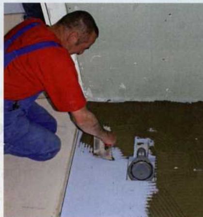
Zur Vorbereitung der anschließenden Montage des Duschelements erfolgt das gleichmäßige Aufbringen von Ansetzkleber auf dem Unterbauelement.