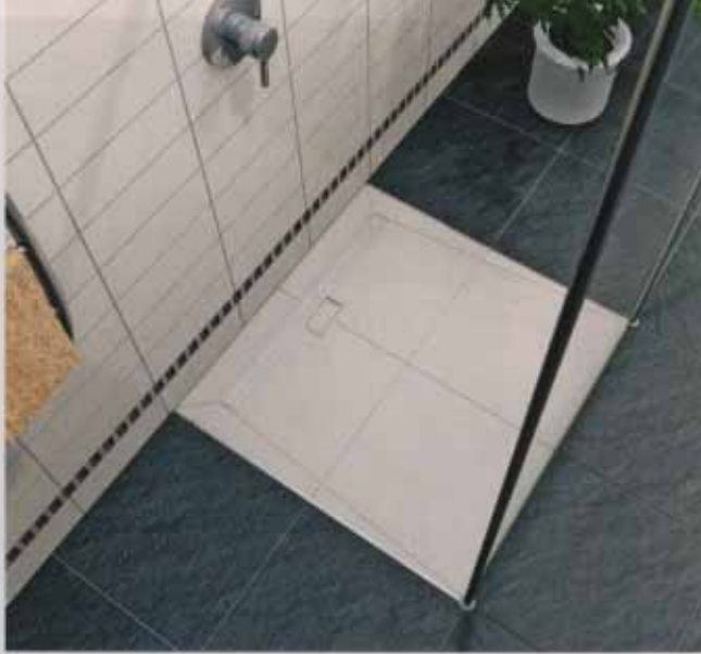
Tub-Line mit Edelstahl-Abflurinne