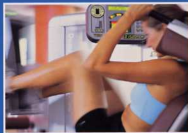
Fitness-Raum: Was bei der Planung zu beachten ist