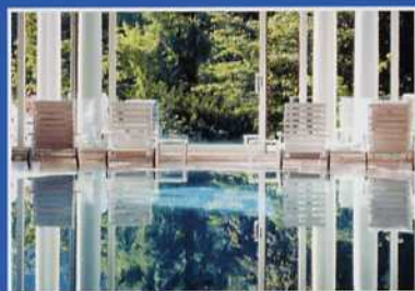
Brenner's Spa: Die Grande Dame unter den Wellness-Hotels