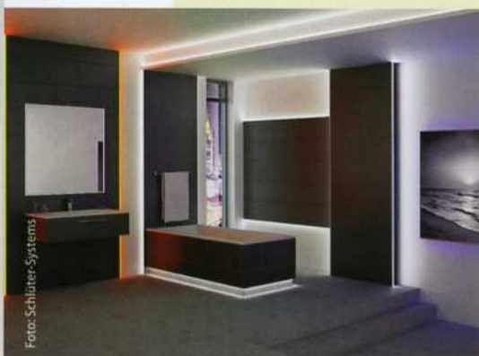
Die Akzentbeleuchtung mit LED-Profilen bietet Schlüter-Systems in verschiedenen Weiß- oder Farbtönen an.

Die Profile sind dank ihrer Schutzklasse IP 65 auch für Feuchträume geeignet. ViSoft lud zum Sehen und Ausprobieren auf seinen Stand ein und zeigte Interessenten, wie Präsentationen jetzt noch komfortabler sein können: Wer sein Planungsergebnis als Panorama mit „ViSoft 360“ speichert, der hat volle Bewegungsfreiheit im Echtzeit-Panorama. Dieses Panorama können Sie Ihren Kunden vor Ort auf einem Smartphone, iPad oder Tablet zeigen. Der Vorteil: Ihre Kunden stehen quasi im Raum und sehen Wand für Wand genau, wie ihr neues Zuhause in Zukunft aussehen wird.