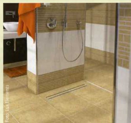
Bei den Duschtassen mit Linienentwässerung von Lux Elements gibt es seit Januar eine neue, selbst entwickelte Rinne.