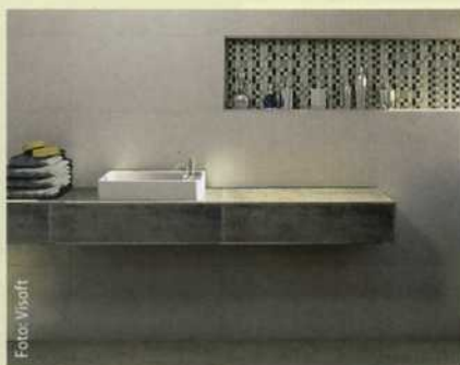
Mit der richtigen Software kann man Ergebnisse wie dieses seinen Kunden schon vorab zeigen.