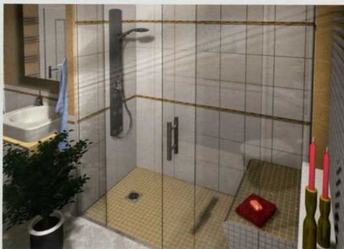
Die Duschtasse TUB-BOL von Lux Elements ist an das Maß vieler Standardbadewannen angepasst.

Das Rinnenträgerelement kann von einer oder beiden Seiten mit dem passenden Gefälleelement ergänzt werden.