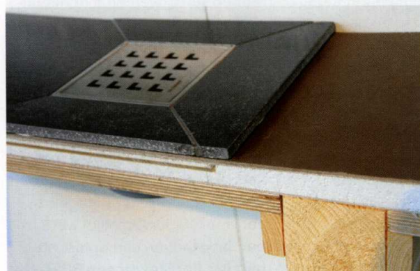
Oplossing renovatie bij douches