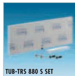
TUB-TRS 880 S SET