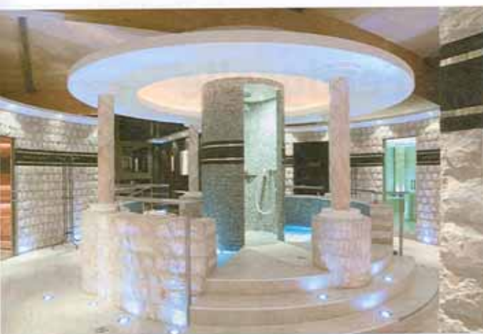
Und so sehen die verkleideten Hartschaum-Elemente aus, wenn alles fertig ist: Hier das Rondell für Kneippsche Anwendungen.

nur ein geringes Raumgewicht bei gleichzeitig hoher Formstabilität. Statisch sind sie deshalb auch ohne Probleme bei größeren Konstruktionen einzusetzen.