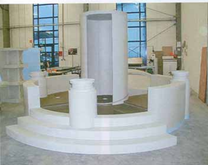
Als vorteilhaft für Großprojekte erweist sich vor allem der hohe Grad an Vorfertigung, der mit dem „Lux Elements-Concept“ möglich ist.