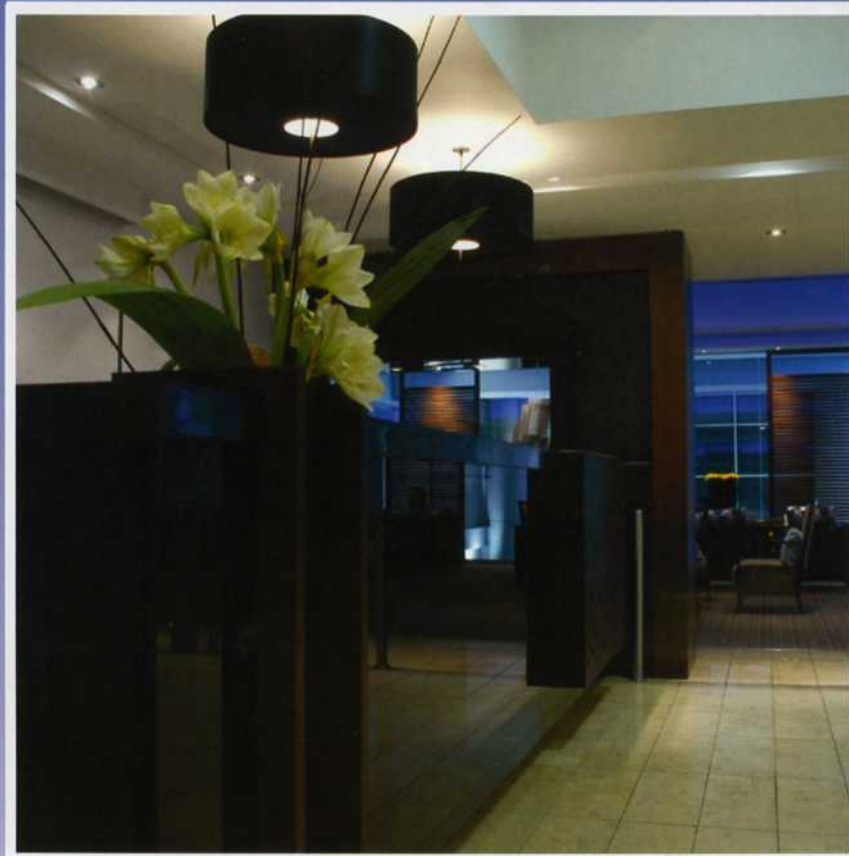
Ausgabe 1 - Januar/Februar 2010 23. Jahrgang G10425