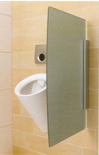
Urinaltrennwände für öffentliche und halböffentliche Sanitärräume von Geberit

satinato grau an. Die Befestigung wird durch eloxiertes Aluminium verdeckt.