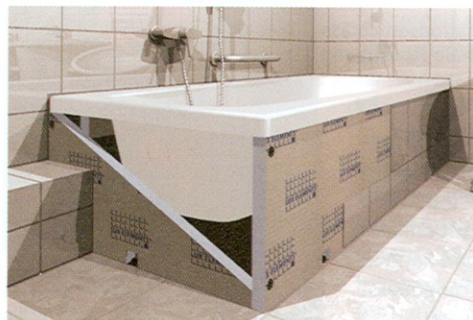
Lux Elements präsentierte auf der ISH Wannenverkleidung für Standard- und Sonderformate mit integrierter Revisionsöffnung

Nischeneinbau, der Einbau in der Ecke, der 3-seitige Einbau mit drei offenen Seiten und der Einbau mit integrierter Kopfablage. Bei allen anderen Formen wie z. B. abgerundeten Eckwannen, ellipsenförmigen, runden oder sechseckigen Wannen oder Whirlpools fertigt Lux individuelle Lösungen. Spezielle Dübel und Kleber erleichtern eine einfache und sichere Montage. Darüber hinaus können weitere Montagehilfen in Form von Anschlägen bestellt werden. Damit bei Whirlpools die Wartung und Reparatur vereinfacht wird, bietet Lux drei Möglichkeiten für Revisionsöffnungen: Bei der Technik Mont-Toprev wird nach der Montage der Ausschnitt an der gewünschten Stelle im Fugenraster herausgeschnitten und mit