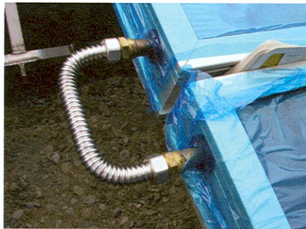
Die schnelle Verbindung auf engem Raum ermöglicht das Eurotis-Wellrohrsystem von Leifeld

Speziell für den schnellen und verschnittlosen Anschluss von Heizkesseln, Trinkwassererwärmern und Pumpen bietet Leifeld das Eurotis-Wellrohr an. Das Edelstahlwellrohr ist für den Trinkwasser- und Gasanschluss zugelassen. Nach dem Ablängen wird mit einem Flanschwerkzeug eine Dichtfläche erzeugt, indem zwei Wellen des Rohres gestaucht werden. Mit einer Überwurfmutter ergibt