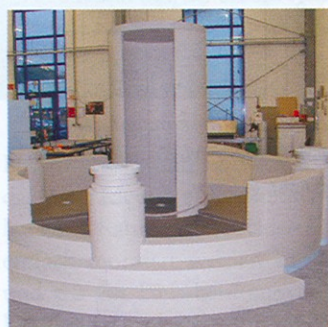
Während der Fertigungsphase bei Lux Elements in der Produktionshalle. Hier ist zu erkennen, wo die Hartschaumträgerelemente unsichtbar zum Einsatz kommen.

Auf 6000 m 2 vereint das 1999 eröffnete Gesundheitszentrum Marburg ein Therapie- und Präventivzentrum, ein Fitness- und ein Sonnenstudio, ein Ärztezentrum sowie seit einigen Monaten die neue Wellness-Landschaft mit angeschlossener Vita Spa Adagio (separater Behandlungsbereich) unter einem Dach. Hinter dem Konzept steht die Idee, Gesundheit und Entspannung sowie Erholung miteinander zu verbinden. Für die Erweiterung wurde das Gebäude um eine 2. Etage aufgestockt. Der Hausherr machte die Vorgabe, einen bereits bestehenden Wellnessbereich im ersten Obergeschoss harmonisch in den Neubau zu integrieren.