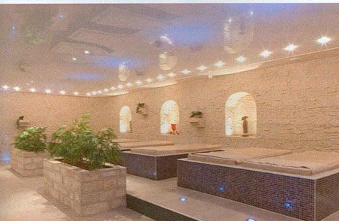
Luxuriöse Entspannung: Blick in den Ruheraum mit Wasserbetten im Gesundheitszentrum Marburg.

im Bereich Estrich und Unterlagsboden der gesamten Anlage, bei Blumenkorpussen, im Caldarium und Tepidarium, bei der Einkleidung des Whirlpools, in den Kneipp-Rondellen und bei den Wärmebänken.