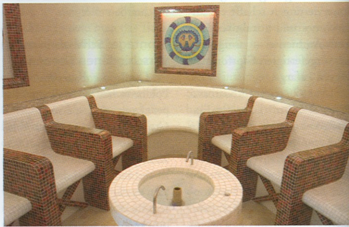
Auch die beheizten Sitzelemente im Caldarium sind aus Hartschaum-Trägerelementen geformt.

Das Unternehmen Sun World, das das 800 m 2 große Projekt auch geplant hat, realisierte die Anlage innerhalb von drei Monaten. Das auf die Wellness-, Fitness- und Solariumsbranche spezialisierte Generalunternehmen erarbeitet maßgeschneiderte Lösungen für alle Kundenwünsche. Die Alles-aus-einer-Hand-Leistungen von Sun World reichen von der Analyse über Pla-