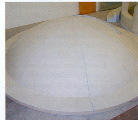
Detailansicht des Rondelldaches während der Fertigungsphase. Deutlich erkennbar ist die Passgenauigkeit der Einzelteile.

Alle von Lux Elements gelieferten Bauteile wurden vor der Auslieferung in den Werkhallen aufgebaut, anschließend in transport- und baustellengerechte Bauteile segmentiert und ausgeliefert. Die industrielle Vorfertigung verkürzt die Montagezeit auf der Baustelle. Sämtliche Elemente sind mit einem Spezialgewebe und einer Spezialmörtelbeschichtung versehen und überzeugen durch sehr gute Haftzugwerte. Die Produkte erfüllen zudem alle Anforderungen der Baustoffklasse B1.