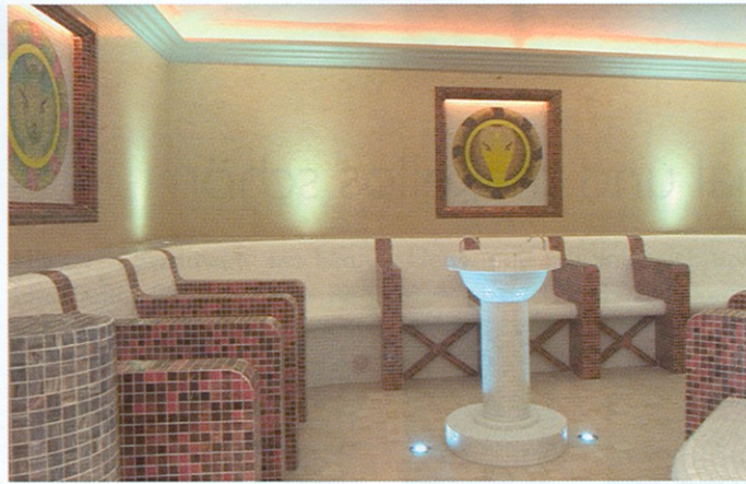
Das Element Wasser ist überall: Der Trinkbrunnen im Caldarium im „Robbau“ (L.) und umgeben von Ruheplätzen im Mittelpunkt des Raumes.

Wände aus Natur-Kalksandstein mit schwarzem Stucco Veneziano und hochwertigem Goldmosaik. Die Wellness-Landschaft umfasst Finnische Sauna, Panorama-Bio-Sauna, Duftgrotte (Tepidarium), Caldarium, Kneipp-Rondelle, Whirlpool, Erlebnisduschen, Dark-Relax-Room (eine Kombination von Stille und Dunkelheit), Ruheraum mit Wasserbetten und den Außenbereich. Ein Highlight ist die Duftgrotte mit integriertem Meeresfisch-Aquarium. Und die Sitzbänke im Caldarium wurden in Form von Sitznischen im Stil der 3. Architekturperiode Pompejis ausgeführt. Um sowohl dem Bedürfnis nach Ruhe und Erholung als auch dem Wunsch zu kommunizieren nachzukommen, wurden in den Ruhezeiten unterschiedliche Konzepte verwirklicht.